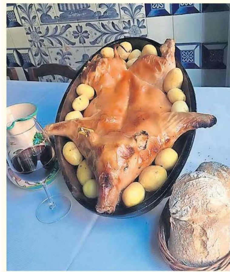
Restavracija Sobrino de Botín je pravi naslov za najboljšega odojka v Madridu.