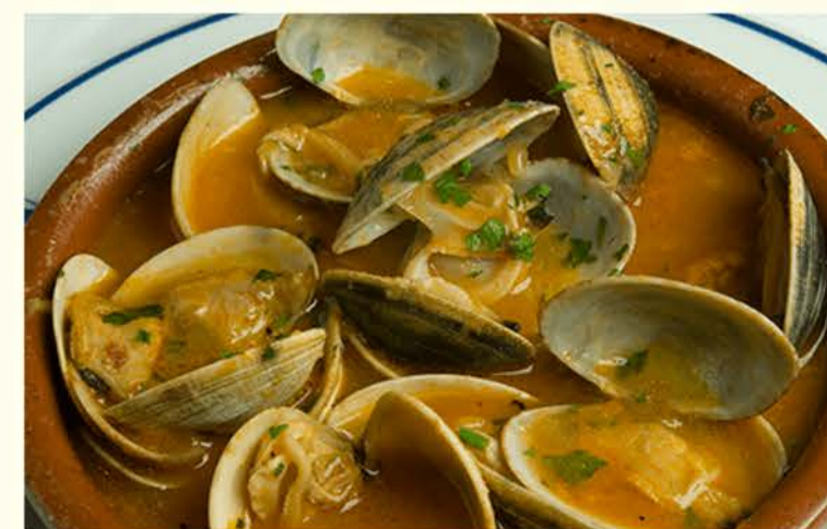
Školjke so pri Botínu servirane v hišni omaki s čebulo, čilij, česnom, paradiznikom in lovrom.